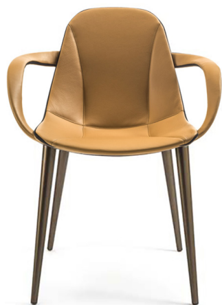
PPF Pelle pieno fiore