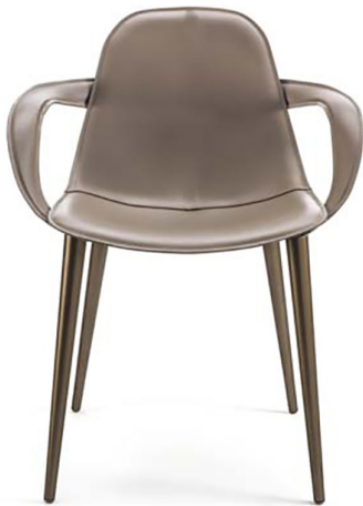
CPF Full grain leather