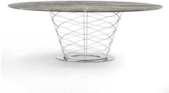
Table with a structure composed of a ring plate, oval or circular, and a second plate of the same shape, laser cut and drawn. The finish is painted with a choice of different colors, the base is chromed. The top can be in glass or marble and various sizes are available.

Cod.40.0701 Design Red Creative Production year 2017